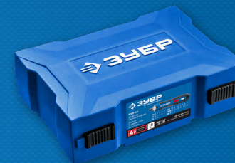
Упаковка: пластиковый кейс