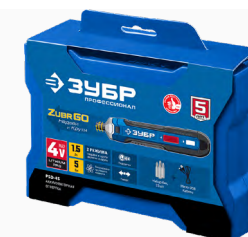
Упаковка: пластиковый кейс