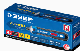
Упаковка: картонная коробка